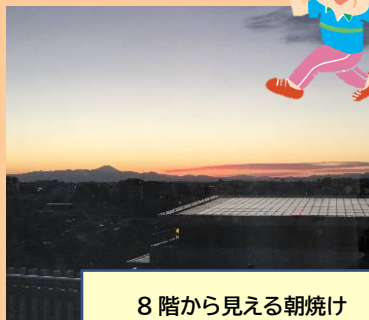
8階から見える朝焼け

ご利用を希望される際はこちらへご相談ください。電話 03-6379-0878 (直) ホームページにもイベントの様子等も載せておりますので、ぜひご検索ください。